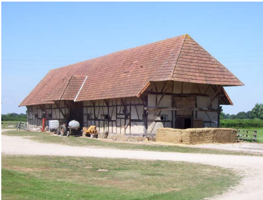
Grange des Mathés (Bien entendu seul les murs et la charpente sont d'époque).

La dîme de Saint Baudille continuera d'être perçue quand la chapelle aura disparu (bien qu'il n'y ait plus ni service, ni entretien à financer).