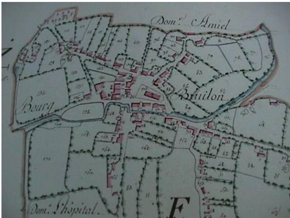
Le bourg en 1809 (extrait du cadastre)

- 1874 : les murs se lézardent tellement que plus personne n'ose se placer sous le clocher durant les cérémonies, craignant qu'il s'effondre. De plus, cet édifice devient vraiment insuffisant pour recevoir les 2360 habitants de notre commune. Le conseil de fabrique propose alors à la mairie de construire rapidement une nouvelle église plus spacieuse. Le conseil municipal accepte, à condition que ceux qui ont des droits dans l'ancienne les conservent dans la nouvelle église. Il souscrit 24000 F et la fabrique 45000 F.